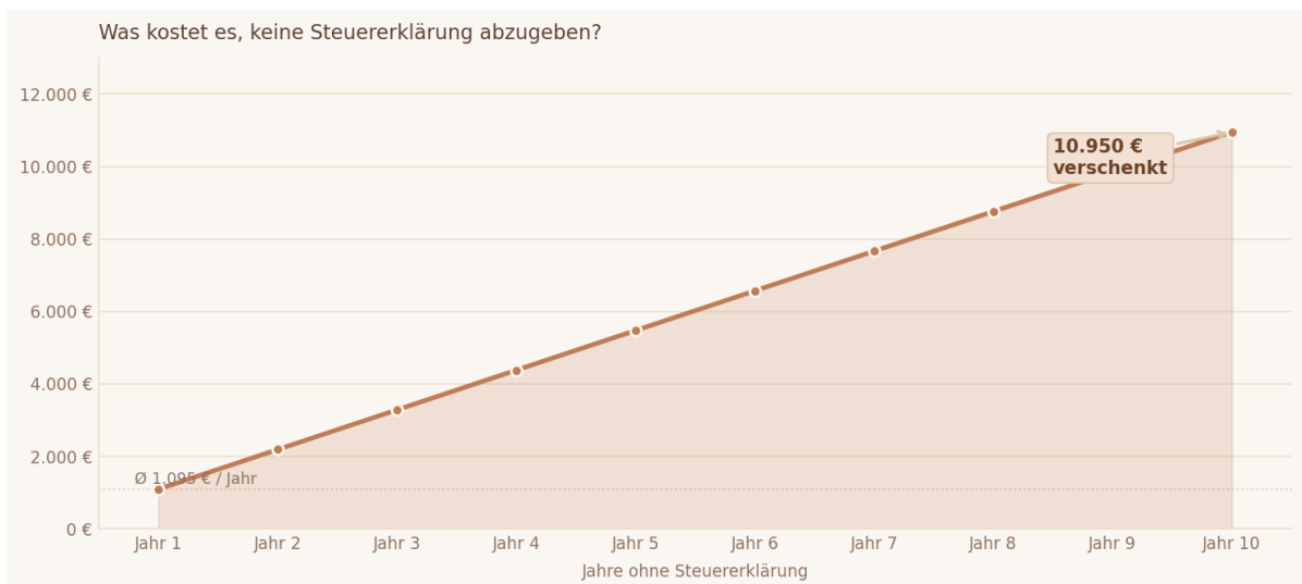
Abb. 1 — Was kostet es, keine Steuererklärung abzugeben? Kumulierter Verlust über 10 Jahre. Basis: Ø Erstattung 1.095 € / Jahr (Quelle: Statistisches Bundesamt). Darstellung ohne Verzinsung.

Fristen, Freibeträge, Checkliste. Los geht's.